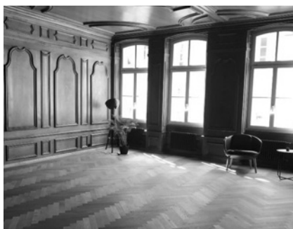
Bewegungsraum KUP Kramgasse 45, 3011 Bern Mittwoch 09.00 - 10.30

Das Konzept lehnt an bekannte Techniken wie dem Yoga, Rudern, Schwimmen, Boxen,.. an. Die Abläufe sind rhythmisch und in konstanter Bewegung. In stetem Versuch die eigenen Möglichkeiten der Mobilität und Kraft auszuschöpfen.