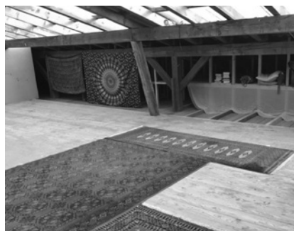
Bewegungsraum Tripty Weissensteinstr. 4, 3008 Bern auf Anfrage oder Vorabinfo

GYROKINESIS® ist ein eingetragenes Warenzeichen der GYROTONIC® Sales Corp und wird mit deren Genehmigung verwendet.